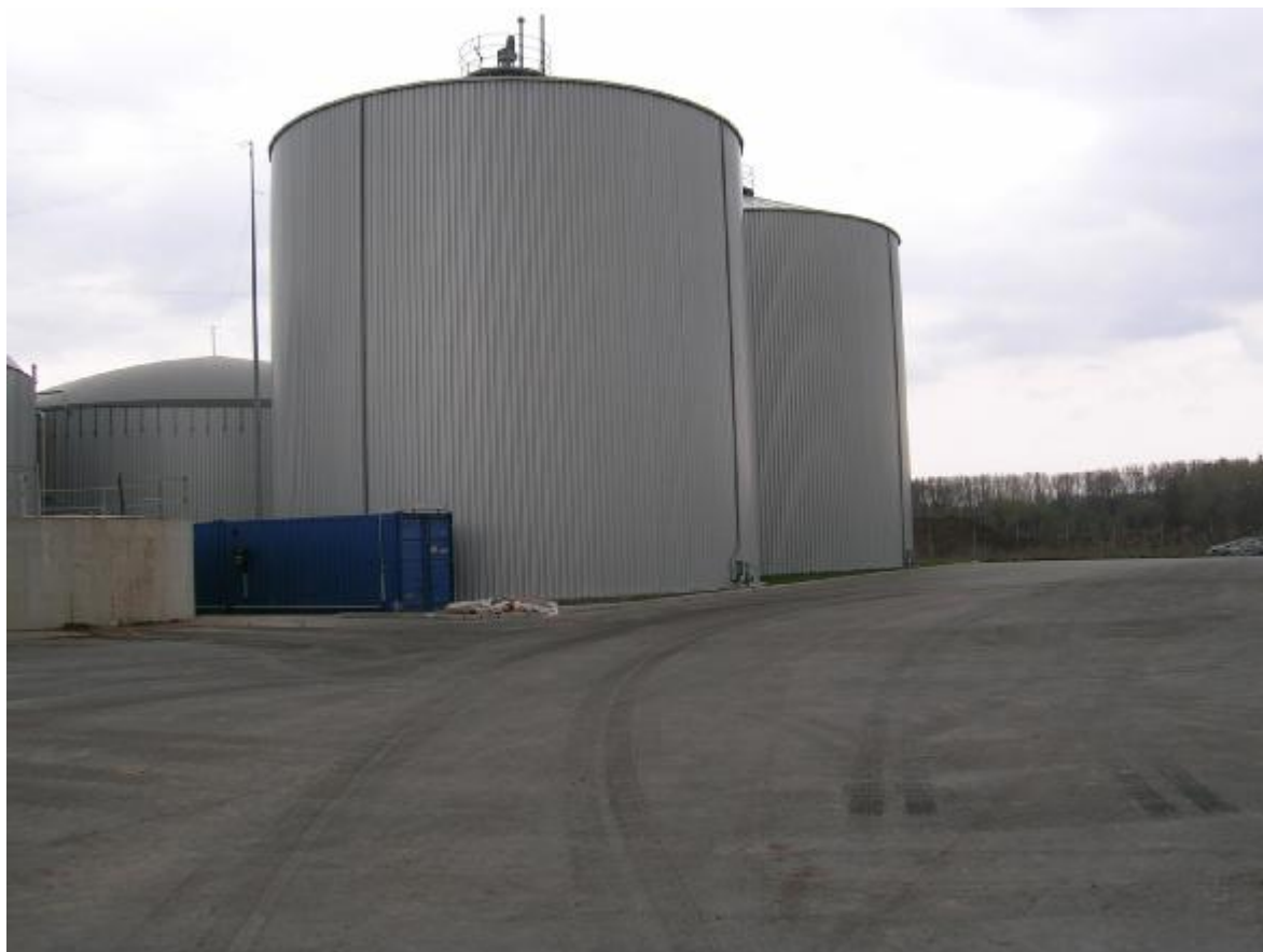
Obr. 1. Příklad velké kofermentační BPS nedaleko Vídně

U různých druhů vstupních surovin je třeba zvážit různě rozsáhlou svozovou oblast tak, aby doprava těchto vstupů byla ekonomicky atraktivní. V případě kejdy je vhodné svozovou vzdálenost maximálně redukovat vzhledem k nízké výtěžnosti bioplynu. Nejefektivnější je umístit zemědělskou BPS přímo v areálu zemědělského podniku a dodávku kejdy zajistit co nejjednodušším způsobem. Naproti tomu u cíleně pěstovaných plodin je svozová vzdálenost podstatně větší a u bioodpadů z komunální či podnikatelské sféry může dosahovat cca 20 km. Vždy by se však mělo jednat o bezprostřední regionální svozovou vzdálenost.