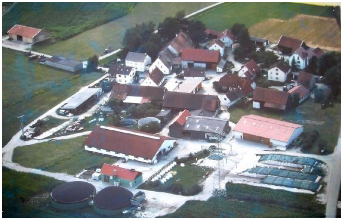
Obr. 6: Bioplynová stanice (ve spodní části obrázku) zajišťuje vytápění bavorské vesničky. Zařízení bylo dodáno firmou agriKomp GmbH.